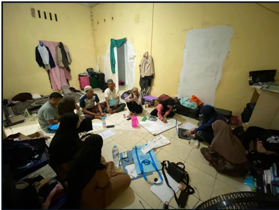
Gambar 2 Rapat Pesiapan Kegiatan Pelaksanaan Kegiatan Fardhu Kifayah Jenazah

Sebelum pendampingan dilaksanakan, maka mahasiswa atas intruksi dari DPL untuk membuat program kerja yang sesuai dengan kebutuhan Masyarakat di Desa Suka Rahmat dan setelah banyak pertimbangan kami memutuskan untuk memberikan program kerja mengenai keagamaan yaitu pelatihan fardhu kifayah jenazah yang dimana ada beberapa keluhan kesah dari warga yang kami temui ketika kami bersilaturahmi ke rumah Rt 1 sampai 20 dan diantara keluhan kesah nya yaitu seperti : Kekurangan tokoh yang bisa paham mengenai pengurusan jenazah dan minim orang yang bisa menjalankan sesuai syariat, dan banyak Rt yang dekat perbatasan Bontang mengambil para tokoh untuk mengurus jenazah di Desa Suka Rahmat, dan pelatihan ini terakhir dilakukan di 2 tahun kemarin yang diadakan oleh PT Indominco Mandiri. Terkait kegiatan kami ini pelatihan Fardhu kifayah jenazah mendapatkan apresiasi dari semua Rt yang kita datangi dan mensupport kami untuk segera melaksanakan dan begitu juga dengan Ibu kepala Desa Suka Rahmat juga membantu apapun yang dibutuhkan saat kegiatan dilaksanakan pada hari Rabu tanggal 10 Januari 2023 yang bertempat di Balai Pertemuan Umum Desa Suka Rahmat.