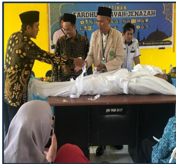
Gambar 8 Tata Cara Pengafanan Jenazah