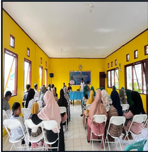
Gambar 6 Pembukaan Pelatihan Fardhu Kifayah Jenazah