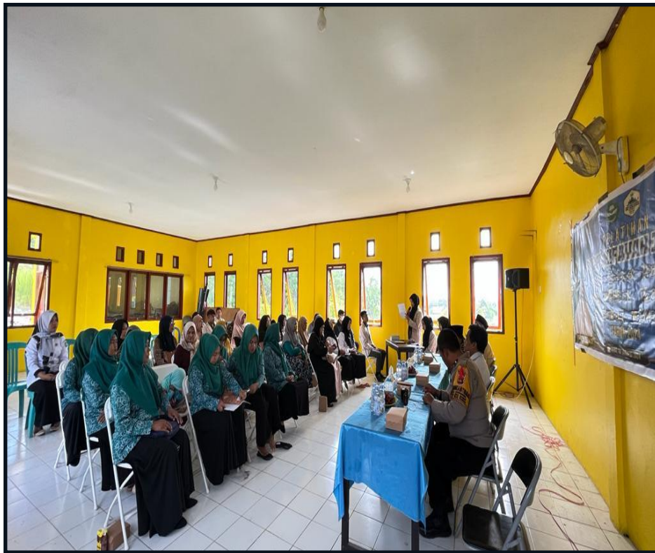
Gambar 4 Pembukaan Pelatihan Fardhu Kifayah Jenazah

pemaparan dan banyaknya pertanyaan-pertanyaan yang dilontarkan dan Ketika praktek berlangsung. Tentu hal ini merupakan respon yang baik, karena ada umpan baik dari peserta.