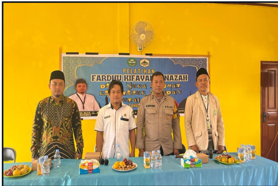
Gambar 5 Pembukaan Pelatihan Fardhu Kifayah Jenazah