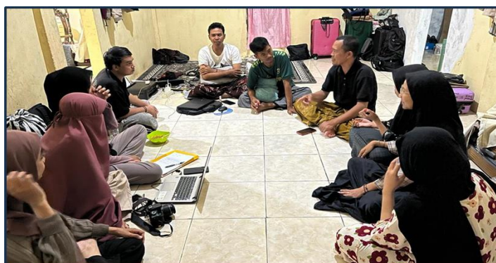
Gambar 11 Rapat Evaluasi setelah Kegiatan

Sebaik apapun rencana yang telah disusun secara matang, pastilah ada yang harus dibenahi secara terus – menerus terutama berkaitan dengan waktu pelaksanaan. Sejak awal direncanakan bahwa pelatihan yang diselenggarakan di Kantor BPU Desa Suka Rahmat ini di mulai jam 08.00 Wita, namun karena satu hal semisal menunggu tamu undangan dan Kepala Desa datang ke Kantor BPU Desa Suka Rahmat ini dimulai jam 08.00 Wita, namun karena satu hal semisal menunggu kehadiran tamu undangan dan Kepala Desa datang ke kantor BPU Desa Suka Rahmat yang sudah ditentukan sesuai undangan, ternyata memakan waktu 1 jam untuk menunggu kehadiran tamu undangan dan sambutan Kepala Desa, dikarenakan adanya komunikasi yang kurang dari pada pihak Desa untuk kehadiran Ibu Kepala Desa untuk sambutan pembukaan kegiatan pelatihan Fardhu Kifayah Jenazah Sehingga jam 09.00 Wita kegiatan baru dimulai, dan ini berdampak pada efektivitas pelaksanaan kegiatan secara keseluruhan. Dengan mundurnya waktu pelaksanaan, tentu mengurangi durasi yang telah disediakan sehingga penyampaian materi tidak bisa santai namun agak sedikit marathon dalam penyampaian. Oleh karena itu, ke depannya harus ada kesepakatan bahwa kedisiplinan mengenai waktu harus lebih ditingkatkan lagi guna pelaksanaan kegiatan agar tepat waktu. 5