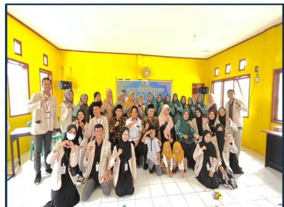
Gambar 10 Foto Bersama