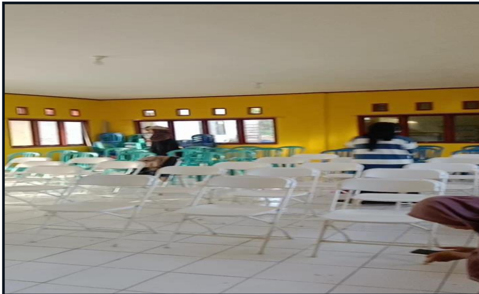
Gambar 3 Gladi Pesiapan Kegiatan Pelaksanaan Kegiatan Fardhu Kifayah Jenazah