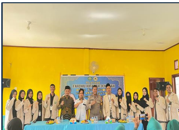
Gambar 9 Foto Bersama