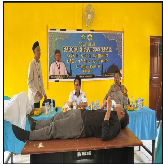
Gambar 7 Pelaksanaan Pelatihan Fardhu Kifayah Jenazah