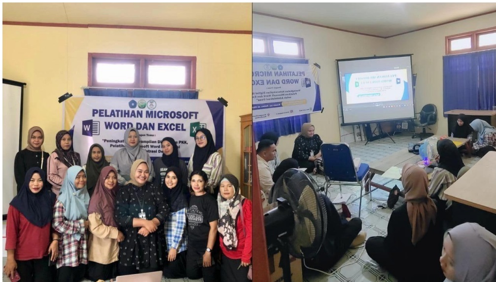
Gambar 1. Kegiatan Pelatihan Di Hari Pertama, Materi Word

observasi menunjukkan bahwa peserta sangat antusias dan aktif dalam mengikuti pelatihan, serta mampu memahami materi dengan baik.