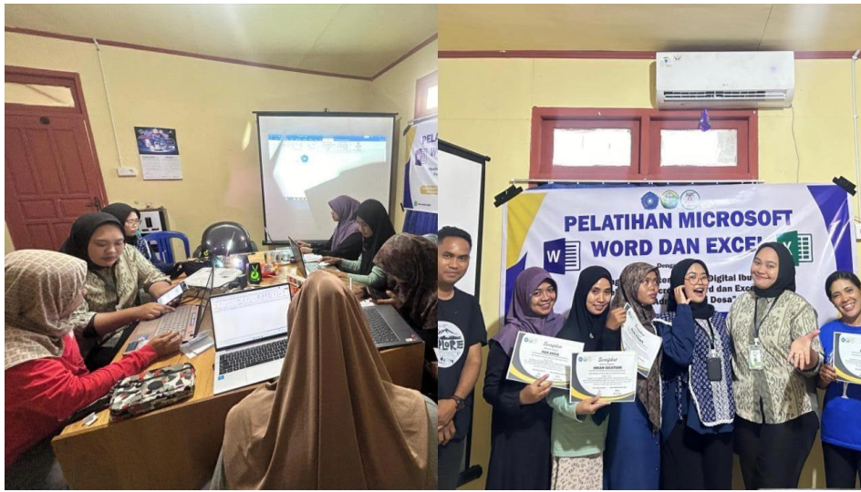
Gambar 3. Kegiatan Pelatihan Di Hari Ketiga, Praktek Pelatihan

Hari ketiga merupakan puncak dari pelatihan, di mana peserta diberi tugas untuk menerapkan semua pengetahuan yang telah dipelajari dalam proyek praktik. Mereka diminta untuk membuat laporan kegiatan PKK dan mengolah data keuangan menggunakan Microsoft Word dan Excel. Proses ini menciptakan kesempatan bagi peserta untuk bekerja secara kolaboratif dan saling membantu dalam menyelesaikan tugas. Mahasiswa memberikan pendampingan dan umpan balik yang konstruktif selama praktik berlangsung. Hasil dari sesi praktik ini menunjukkan bahwa peserta tidak hanya mampu menghasilkan dokumen yang rapi dan terstruktur, tetapi juga mulai memahami pentingnya administrasi yang baik dalam organisasi mereka.